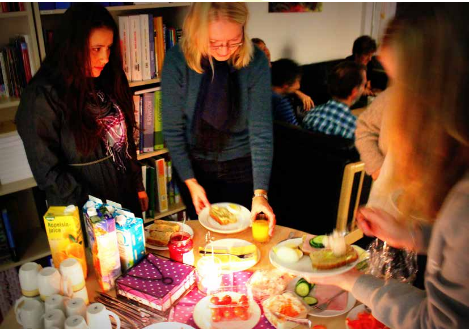
Ein tysdag morgon i november: Fulldekkra frukostbord på pauserommet på Tryggheim ungdomsskule. Utan tvil eit trivselstiltak.