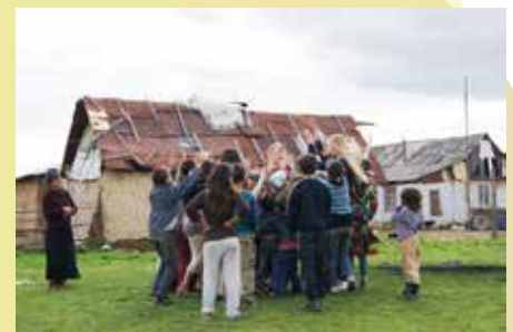
Å boogie, boogie, boogie er alltid ein slager.

- Ein periode døydde åtti personar av kulde i «vårt» område. Om vinteren er det stort behov for varme klede, men om sommaren er det gildare med leiker, seier jentene og