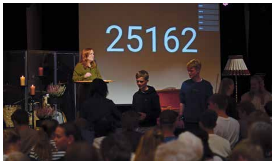
Kvelden vart avslutta med tradisjonsrik basar.