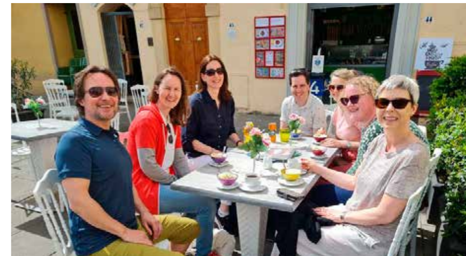
I mellomalderbyen Fiesole, som ligg i åsane over Firenze, fekk vi ekte italiensk gelato (is).

Både gjennom aktivitetar og kveldssamlingar vart det bygd godt fellesskap, og mange vart betre kjende med tilsette dei ikkje så ofte treff på i kvardagen der folk sit i kvar sine avdelingar og med kvar sine ulike oppgaver.