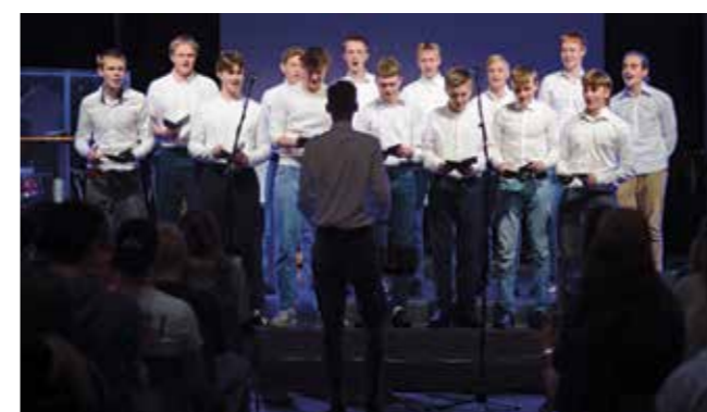
Tryggheim mannskor song på festen i møtesalen under temadagen.