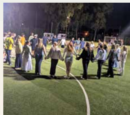
Lek og moro på kvelden

og Pantheon ga elevene innføring i hvordan det antikke Roma hadde vært. De fikk se Scala Santa (kapellet «Den hellige trapp»), som fikk stor betydning for Martin Luther. Vi var også innom Frigjøringsmuseet i Roma, hvor vi lærte mer om hvordan 2. verdenskrig opplevdes i Italia og fikk historier om enkeltskjebner. Underveis i programmet ble det plass til mye god mat. Selv om noen ikke fant farse, fant de veien til den nærmeste McDonald's når hjemlengselen ble for stor. Andre lærte at ansjos er en fisk, ikke grønnsak. Flere kvelder spiste vi samlet, og summingen og godlyden fra elevene som spiste og koste seg tolket vi ledere som at de hadde det fint. Vi lederne som fikk lov til å følge denne gjengen på tur ser tilbake på en kjekk tur, og en positiv gjeng. Takk for turen!