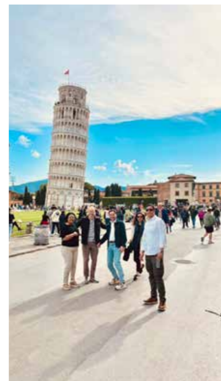
Nokre tok turen til Pisa.