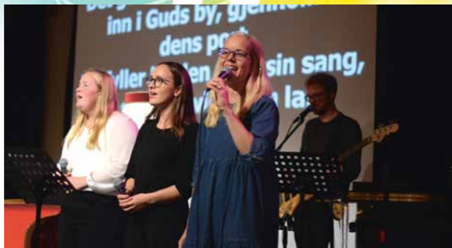
Husbandet var òg på plass, og leia forsamlinga i allsong.