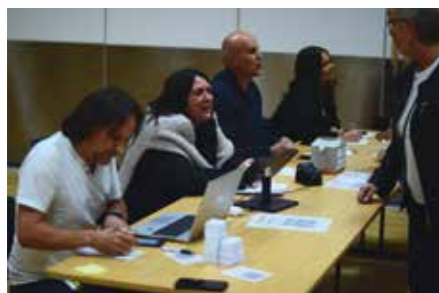
Mange gode tilsette var med og hjelpte til under kvelden.

Velkommen tilbake til neste Huslydkveld 9. april!