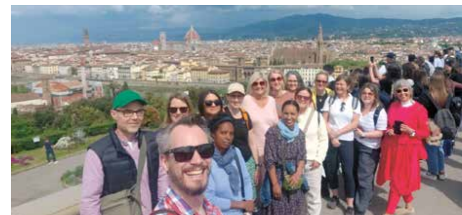
Ein god gjeng samla på Piazzale Michelangelo med utsikt over sentrum av Firenze.