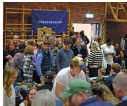
18 ungdomsbedrifter stilte ut i gymsalen.