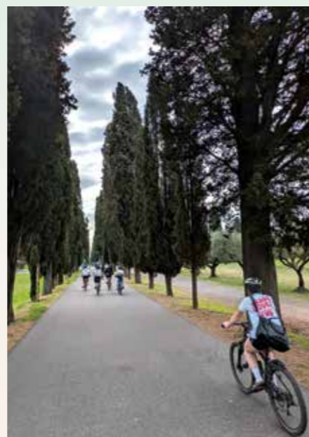
Sykkeltur langs via Appia