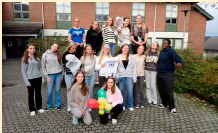
Elevene i 1HOD er klare for et artig naturfageksperiment.