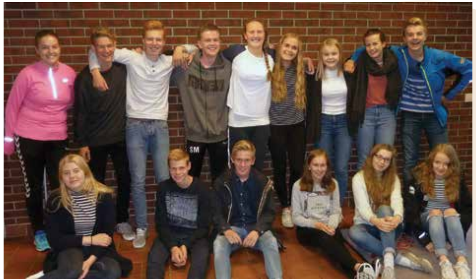
Den historiske klasse 1STC – for første gang er det tre paralleller på Studiespesialisering (tidl. Allmennfag).

I år er vi så heldige å ha hele tre miljøarbeidere og en internat- og fritidsmedarbeider i tillegg til den faste staben som har ansvar for det sosialpedagogiske arbeidet. De har alle gjort en strålende innsats med å få nye og gamle elever til å føle seg velkommen og inkludert. De har arrangert turer, sosialkvelder og morsomme aktiviteter på fritiden. Vi tar med noen bilder fra oppstarten.