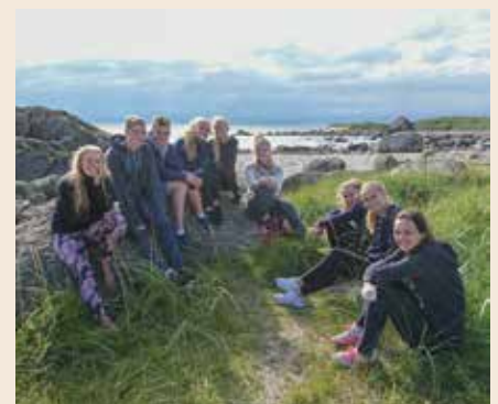
En flott dag på Brusand.