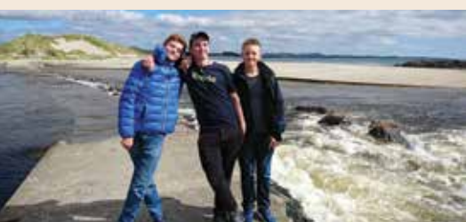
Tøffe gutter ved strand.