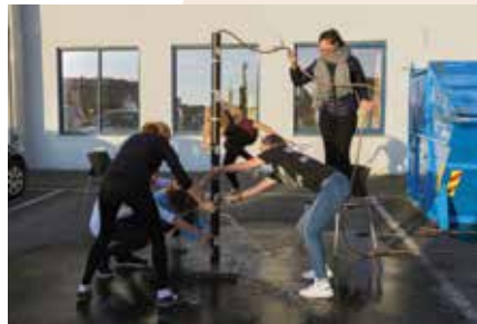
Teambuilding på parkeringsplassen.