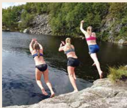
Klar ferdig GÅ!