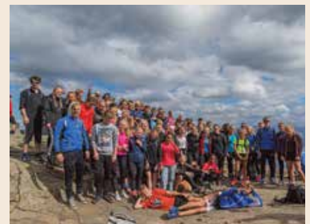
Endelig på toppen av Prekestolen!