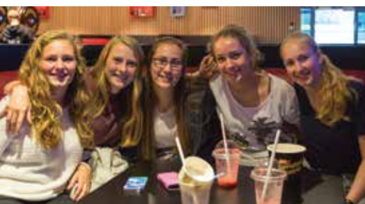
Fornøye jenter på bowling.