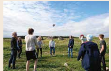
Ballspill på Jærstrand.