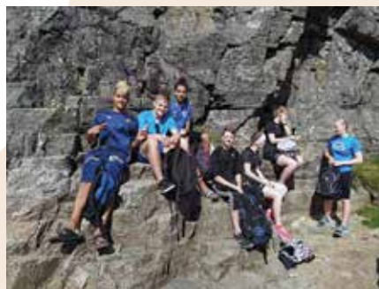
En pust i bakken på vei opp til Prekestolen.