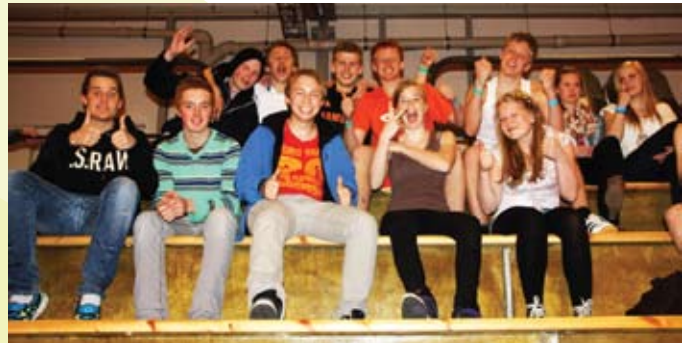
Interesserte tilskodarar til fotballkampane