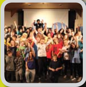
Ein svært «dramatisk» lærer s. 6