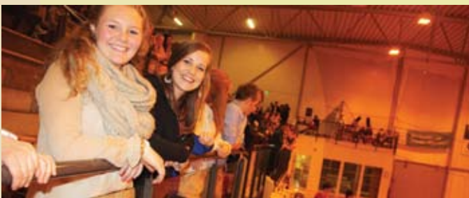
Smilande jenter