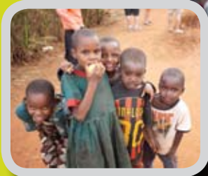
Russetid med mye mening s. 8