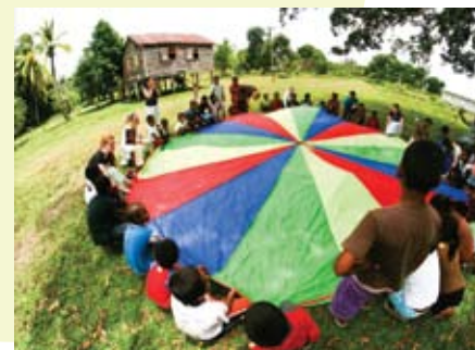
Barna i landsbyen syntes det var kjempestas å få leke med russen fra Norge.