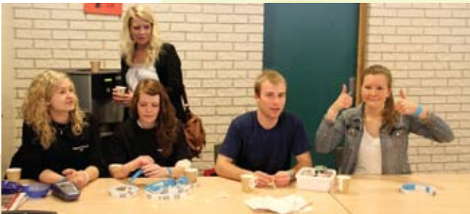
Billettkontoret under Grand Prix

Fredag 21. april arrangerte russen Tryggheim-cup (fotball). Laurdag var det Grand Prix. Då kom gjester både frå Lundeneset vgs. og frå andre skular. Nedanfor er nokre bilete frå arrangementa.