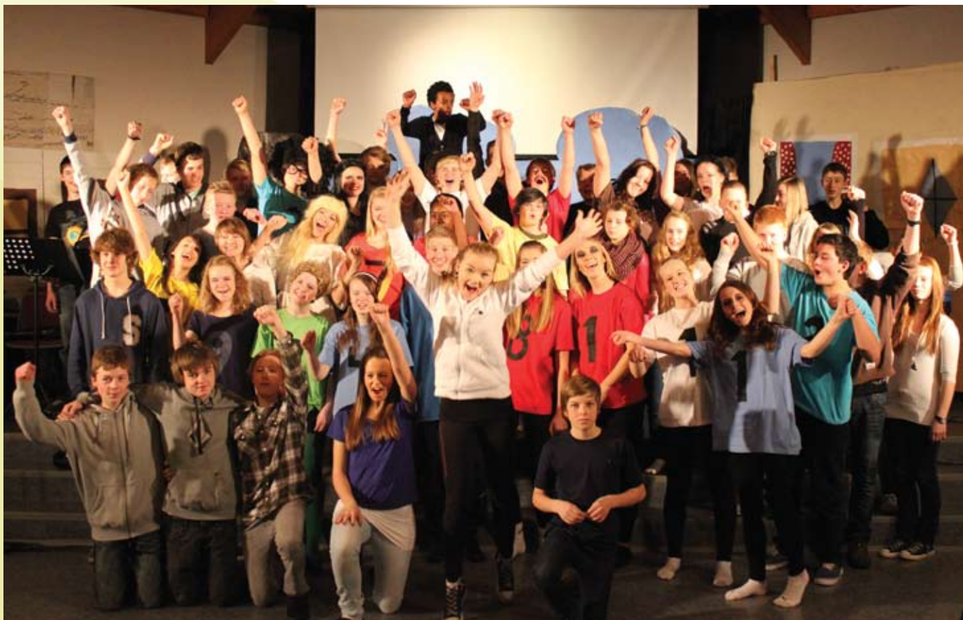
Årets niendeklassingar, som stod bak førestillinga «Lygolia».