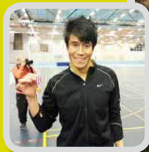
Langdistanse s. 10