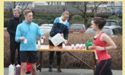
Skal det vera eit glas vatn i forbigarten?