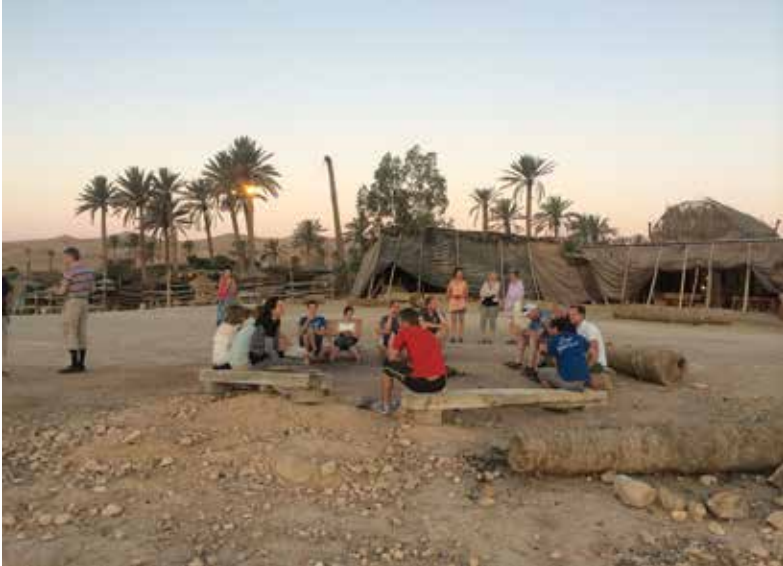
Vi er klare for en natt i beduinleir