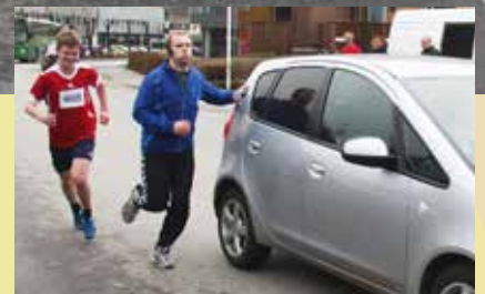
Hmm...nyttar redaktøren vår ufine metodar for å kome seg raskare fram?

Me lever i ei tid der ting skal skje kvikt. Å springa nokre rundar går langt fortare enn å sy ein hardangersaumsduk. Meir sosialt er det òg. Og når midlet leier til føremålet, og alle har det morosamt attåt, lyt sjølv gamle gle seg.