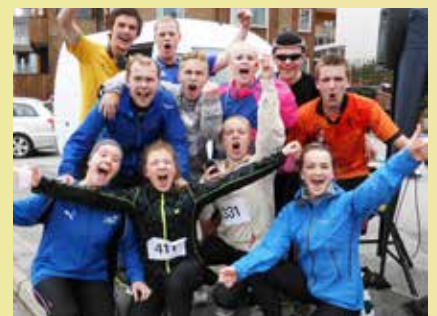
Ihuga deltakarar etter målgang