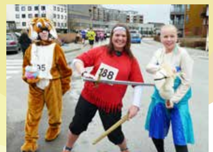
Nokre hadde kledd seg ut for anledninga