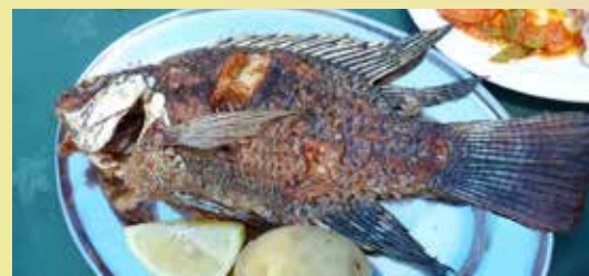
Vi får servert St. Petersfisk. Den har fått navnet etter gullmynten Jesus ba Peter finne i magen på en fisk og betale i skatt.

Noen hadde på forhånd vært veldig i tvil om de skulle melde seg på Israelsturen eller ikke. Etterpå var ingen i tvil om at dette