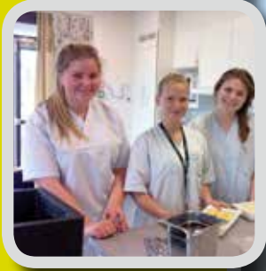
På Klokkarhagen s. 4