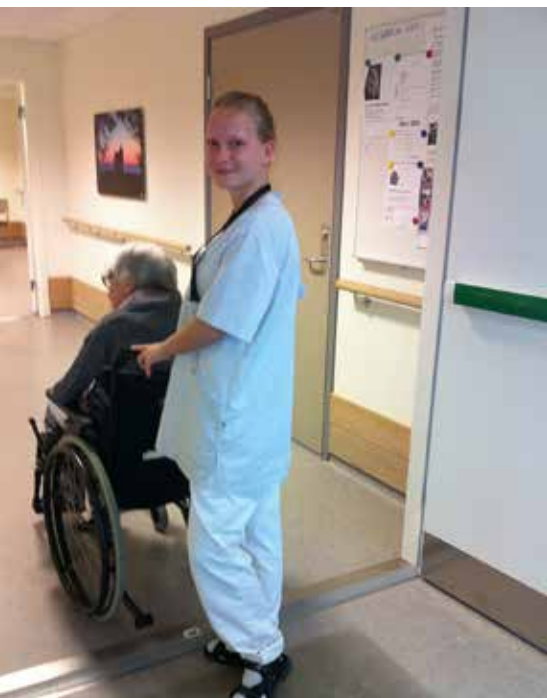
Allis i aksjon på Klokkarhagen.