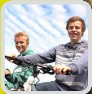
Fredsarbeid s. 6