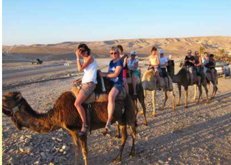
Vi skal ri inn i solnedgangen på kameler – eller var det dromedarer?