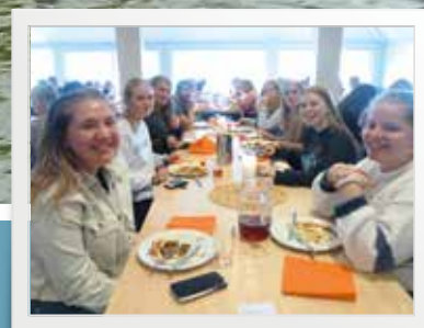
Russe-kick-off med smak av utlandet s. 15