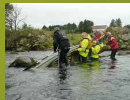
Tur- og friluftsgruppa fikk også i år arrangert kanotur for alle som ville være med. Turen gikk fra Øksnevad til Bore, og første velt kom allerede ved vadesteinene på Øksnevad. Det ble flere velt etter hvert, litt vannkrig og mye godt humør. Noen var ganske våte og kalde til slutt, så da hjalp det å avslutte turen på McDonald's.