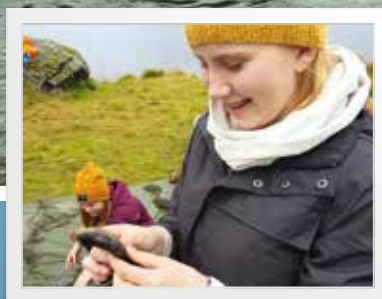
Skit fiske s. 7