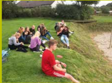
1ST-klassene trengte bare å gå ned til «naboen» for sitt først sammensveisings-arrangement i august - vi fikk en flott ettermiddag på områdene rundt Tryggheim ungdomsskule med sporlek, ballspill, pizza og mye sosialisering.