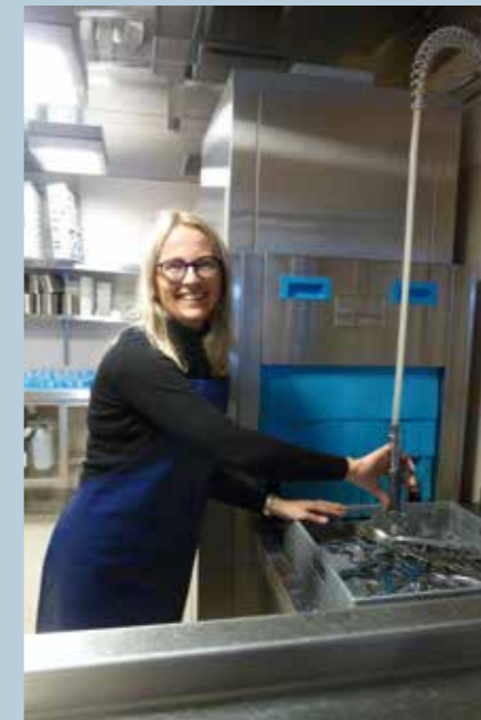
Flatebø i oppvasken

I løpet av arrangementet valde Vg3-elevane russetyre og sette seg deretter i mindre grupper for å ha idedugnad. Kick-off blei avslutta med ein internasjonal fest i dei 120 russemunnane då indiske og kinesiske rettar blei serverte i matsalen.