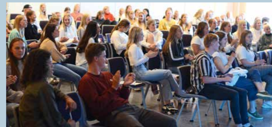
Russen i møtesalen