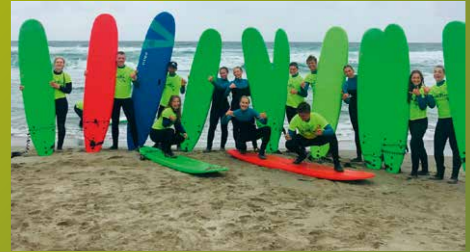
I september reiste breddeidrett-elevene til Hellestø på surfekurs.