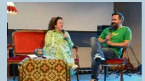
Bjuland og Selstø