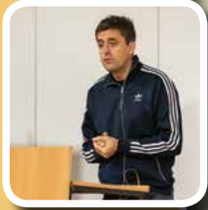
Livsmeistring s. 5