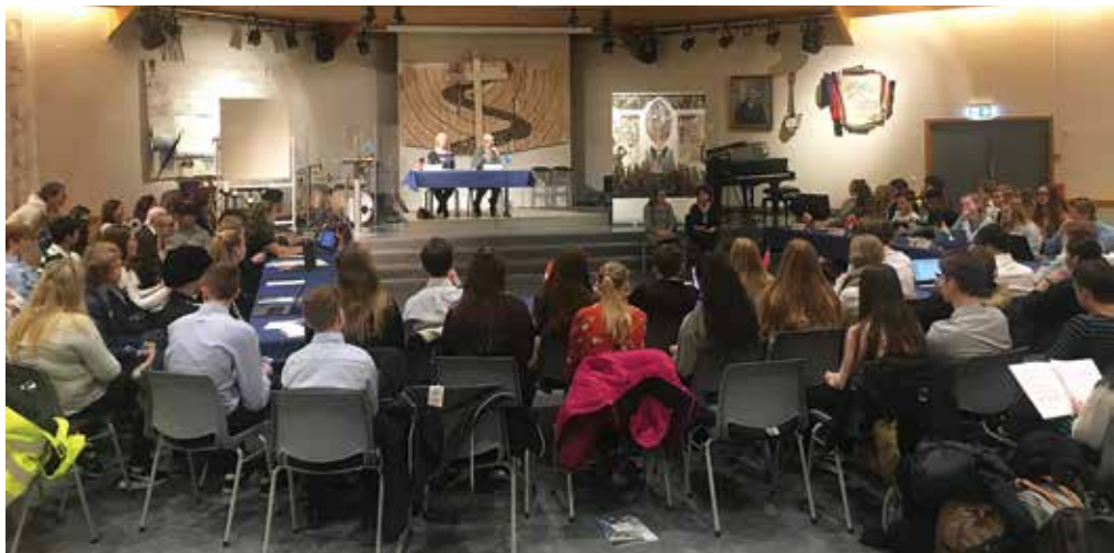
FNs Tryggingrådet besøkte Tryggheim ungdomsskule 30. januar.

stoppa konflikten, landa har ulike meiningar, haldningar og omsyn dei skal ta. Det er også gamle og nye alliansar det skal takast omsyn til. Alt dette gjorde at det blei vanskeleg å vedta ein klar og konkret resolusjon, altså blei FN-rollespelet nokså realistisk.