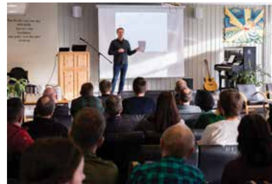
Alle lærarane var til stades i daglegstova då Tryggheim fekk plaketten av Dysleksi Norge.