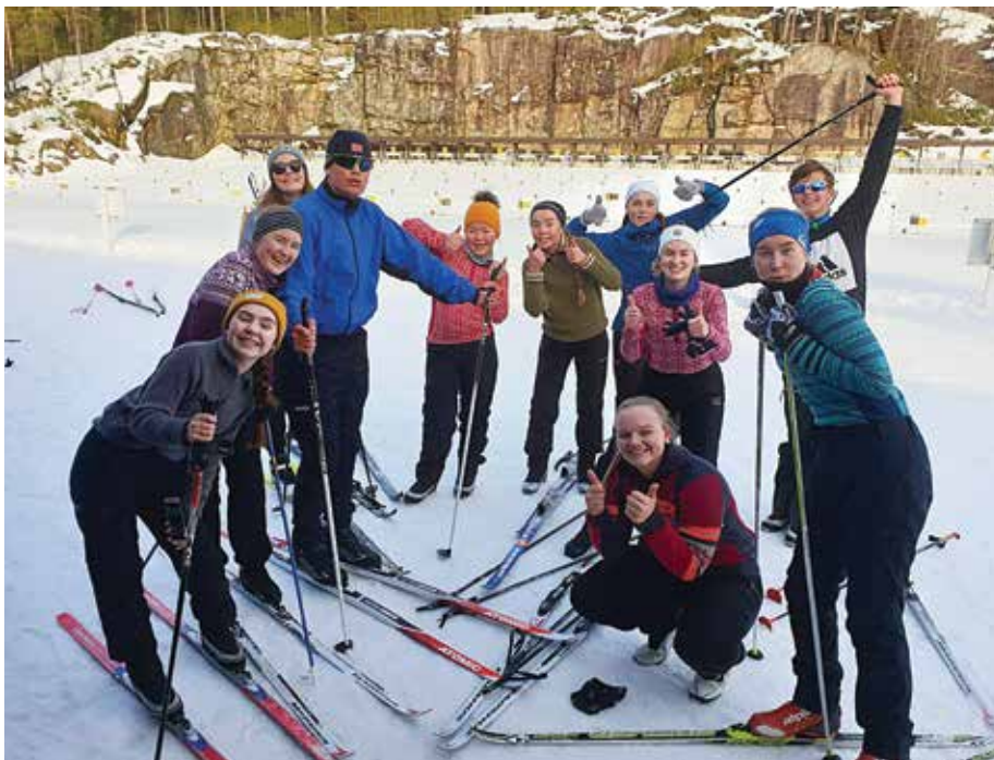
Blid gjeng på Feed Skiarena.