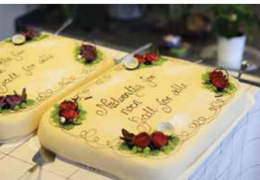
Marsipankaker stod på menyen då Tryggheim fekk plaketten som fortel at skulen er dysleksivenleg.