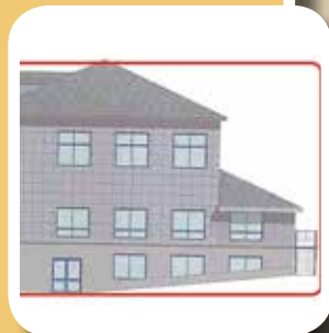
Tryggheim utvidar s. 10