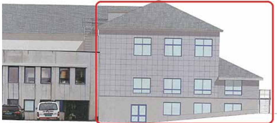
Fasade vest. Kjelde Novaform AS (utsnitt av teikning).