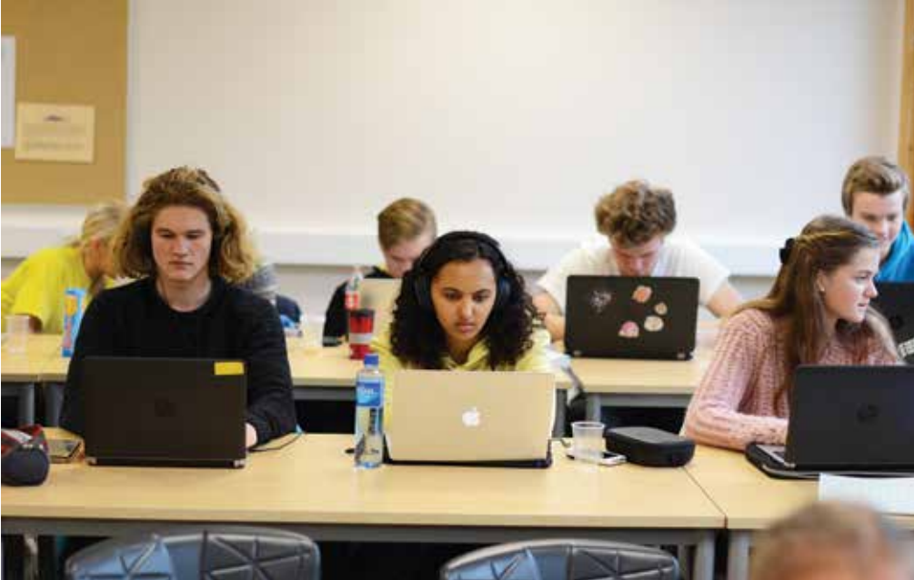
Konsentrerte vg3-elevar på skriveverkstad.

Trykk: Lura trykkeri AS Layout: Tubb (Oddbjørn Myklebust)