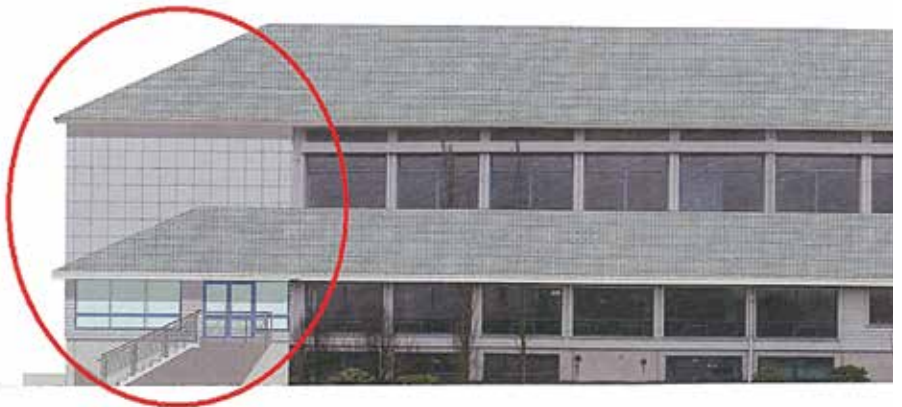
Fasade sør. Kjelde Novaform AS (utsnitt av teikning).