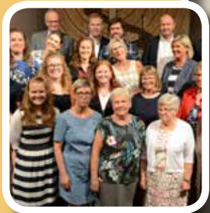
Elevstemne s. 8-9