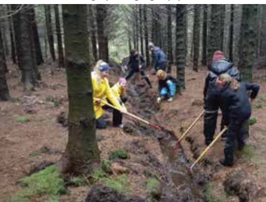
Niandeklassingar i ivrig arbeid i skogen.

Elevane i 10. trinn arrangerte misjonsfest for heile skulen 26. september. Elevane sjølv stod for alt som blei gjort, frå å leia, spela og synga, til baking og sal av kaker, planlegging og gjennomføring av tivoliaktivitetar, utlodding, rydding og mykje anna.