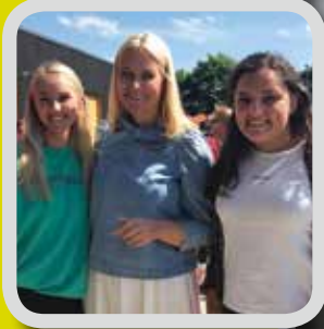
Royalt og litterært s. 3