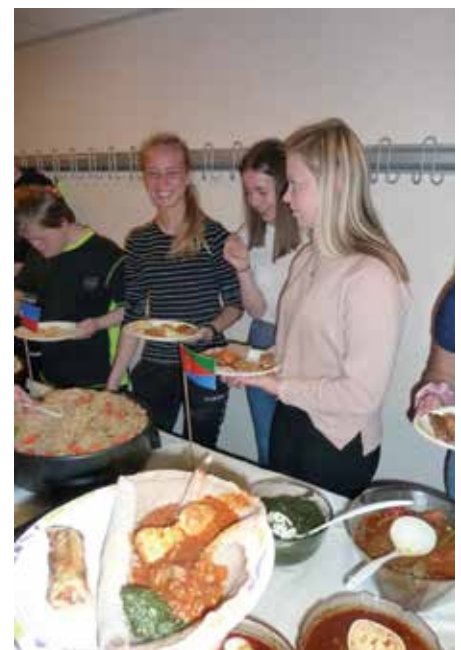
Skal det være indisk eller eritreisk?