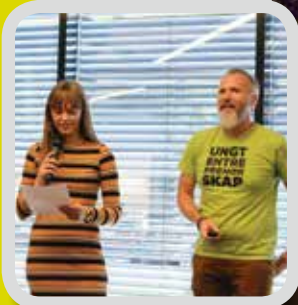
Ungdomsbedrift s. 4-5