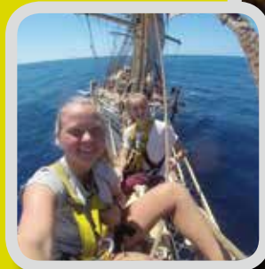
Skule på bøljan blå s. 10