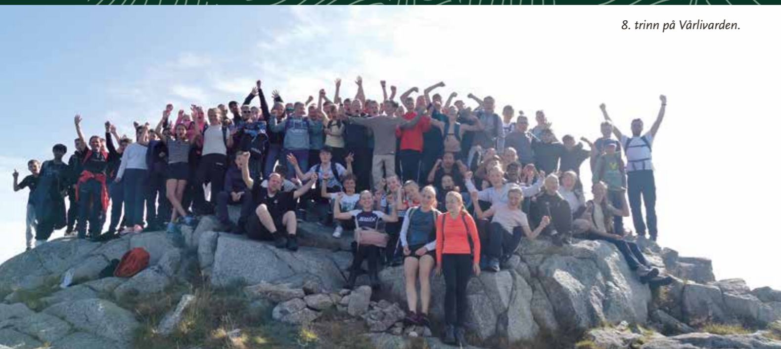
8. trinn på Vårlivarden.

Til Horve 2 vart det ein liten bomtur, her hadde nemleg ein annan skule okkupert plassen, og ein måtte finna ein stad i nærleiken der ein kunne setja seg ned. Det førte til at nokre lærarar kom på avvegar, men òg frå denne turen kan ein melda om god lyd og godt humør.