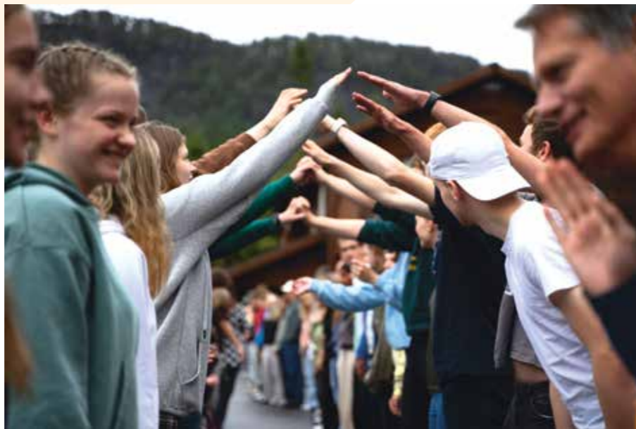
Vg3 på russeweekend.

Den siste helga i august reiste heile 130 Vg3-elevar til leirplassen Tonstadli på russe-weekend for å knyte sosiale band på tvers av klassane. For første gong har skulen fem Vg3-klassar som er heilt fulle.