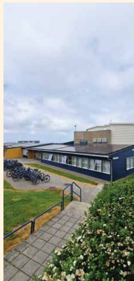
Nyoppsett solcellepanel som badar seg i junigrønt.