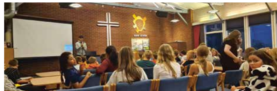
På kvelden blei det både møte og underhaldning.

På heimreisedagen, midt i 50-leiken, kom plutselig bussane. Elevane og nokre lærarar fekk plass og sette nasen heimover. Igjen var det ein liten gjeng lærarar som rydda litt før òg me sette oss i mini-bussen og reiste heim. I minibussen var det stille, turen var over, me var slitne, men òg glade og takksame. Takksame for ein vellykka tur. Takksame for ein gjeng positive og flotte elevar som me gler oss til å bli endå betre kjent med.