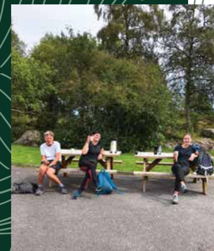
Ein velfortent kaffipause.