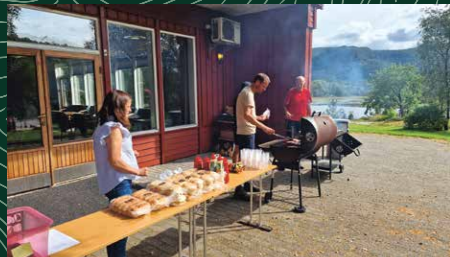
Steiking av burgarar og pølser.