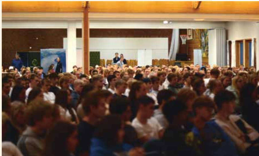
Full møtesal under skuledebatt.

- Det har vore veldig mykje å glede seg over i oppstarten. 220 elevar bur på internat, og veldig mange heimebuuar prioriterer å vere med på det som skjer i Tryggheim sin regi etter skuletid, seier rektor.