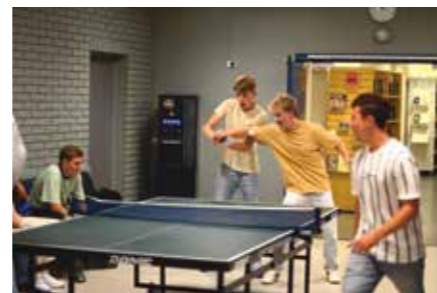
Vg1-elevar spelar bordtennis.

Den siste helga i august reiste heile 130 Vg3-elevar til leirplassen Tonstadli på russe-weekend for å knyte sosiale band på tvers av klassane. For første gong har skulen fem Vg3-klassar som er heilt fulle.