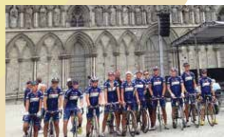
Syklistane har nådd Trondheim og Nidarosdomen.