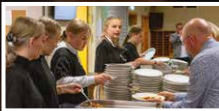
Mange elever var i sving under matserveringen.

Vi takker alle fremmøtte som var med oss på feiringen og gjorde festen til den fantastiske markeringen det ble. Takk også for en flott gave på kr. 163.000, og til alle som kjøpte jubileumsbøker.