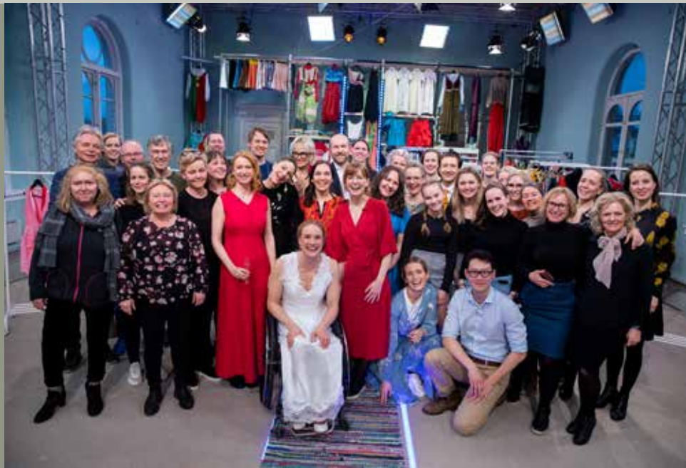
Dei involverte samle rundt vinnaren