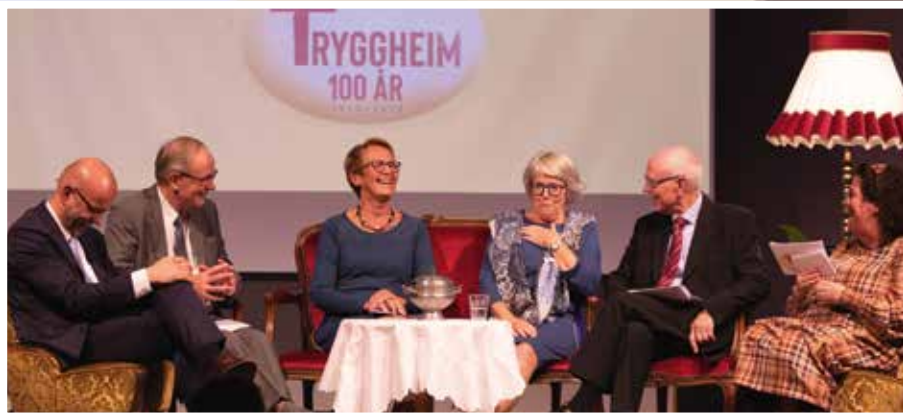
Tidligere lærere og rektorer minnes hvordan det var «da vi styrte Tryggheim».