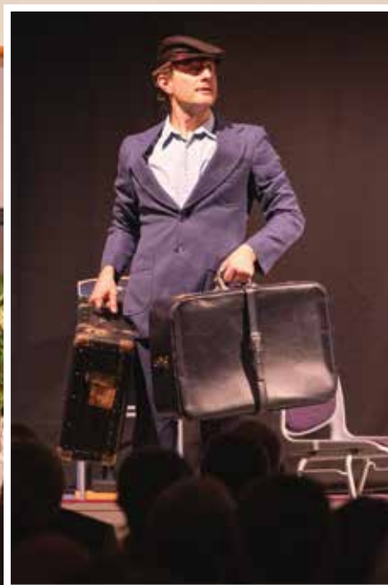
Det var nok ikke alltid like enkelt å komme som ny lærer inn i et veletablert internatskolemiljø.