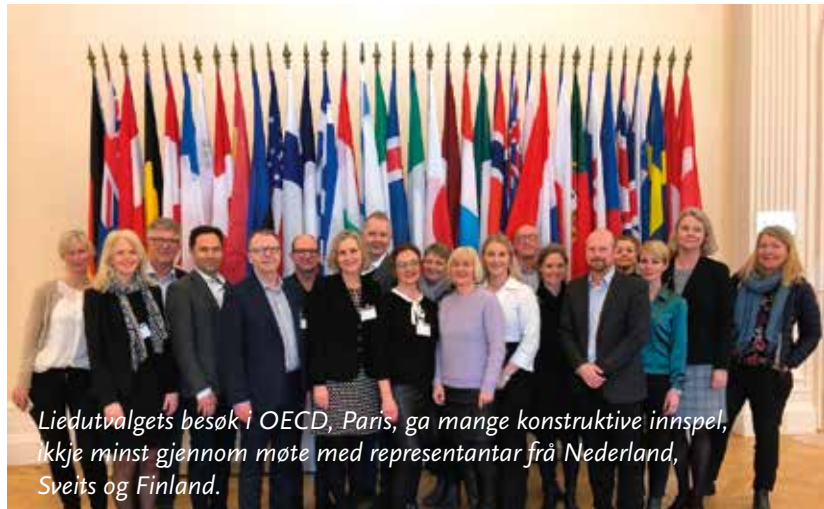
Liedutvalgets besøk i OECD, Paris, ga mange konstruktive innspel, ikkje minst gjennom møte med representantar frå Nederland, Sveits og Finland.

Sitatet over slo mot meg ein haustdag på sosiale medium, formidla gjennom eit bilete av ei mekanikarhand med ein fastnøkkel. Delt ikkje mindre enn 13.000 gonger, stod det.