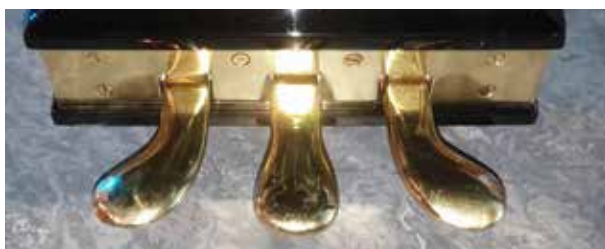
Nypolert clutch, brems og gass

i seg sjølv til å setje i gong ein ny EU-debatt. Lyset gjev gjenskin som marssol på frosne fenner i den tjukkswarte polyesterlakken, og dei polerte messingdetaljane blenkjer så ein middels gardemusikant ville spontandesertert i pur mindreverds skjensle. Synet får elles stabile personlegdomar på mellomleiar nivå til å testkøyre tårekanalane, og før- og etterbileta talar sitt tydelege språk om at sjølv dei mest dehydrerte finn grunn til å bli blanke i augo. Leiinga undersøker no om det finst tilsvarende overhalingsordningar for tilsette.