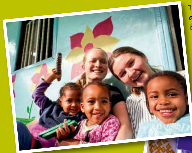
To norske GUS-elever som trives i barnehagen!

Dette er uten tvil noe av det mest spennende jeg har fått være med på! Å leve så tett på en annen kultur, med så imøtekommende og nydelige mennesker anbefales virkelig.