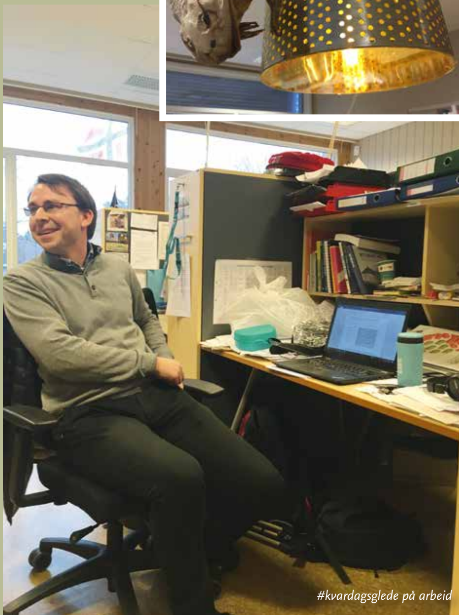
#kvardagsglede på arbeid