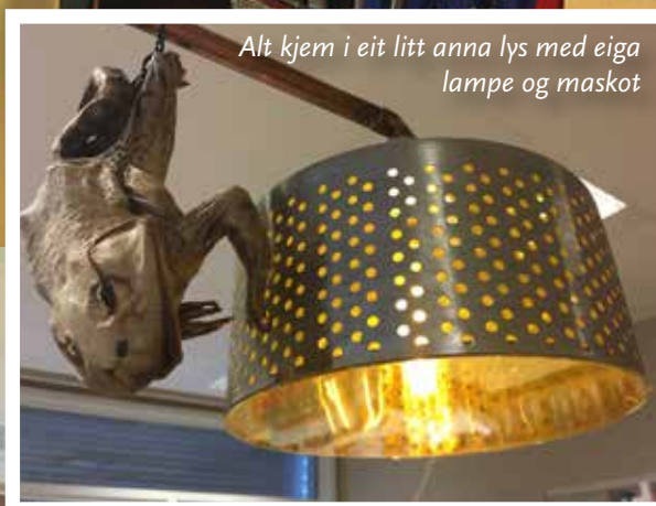
Alt kjem i eit litt anna lys med eiga lampe og maskot