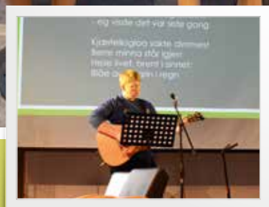
Poesifestivalen er komen for å bli s. 4-5