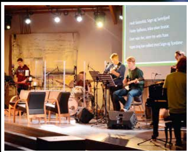
Country-låten «Fylkesveg» gjekk til topps i gjendiktningskonkurransen.