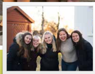
Fra Tryggheim - og ut i verden s. 18-20