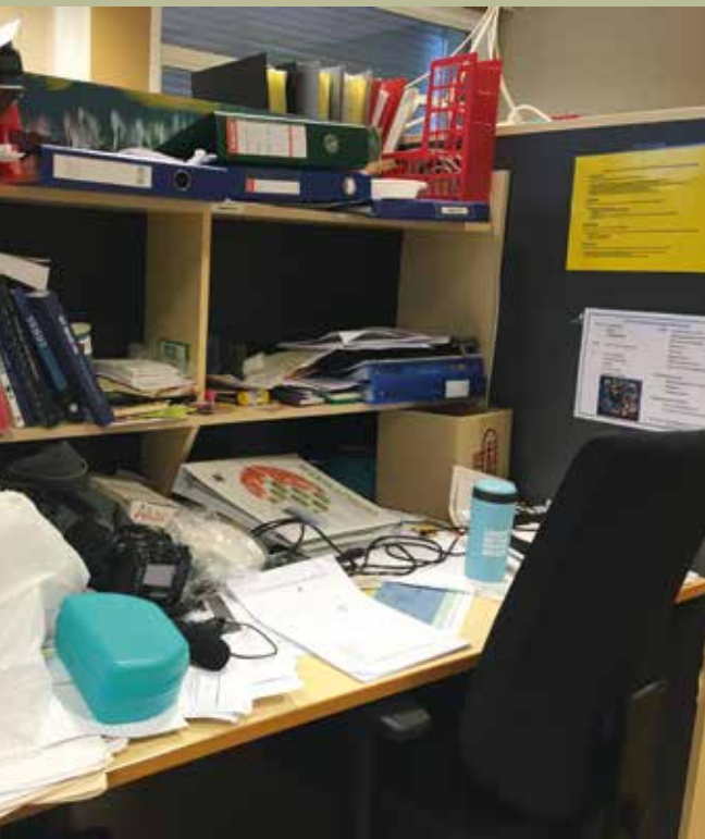
Atypiske arkivsystem gir kreativiteten spelerom

ungdomsbedrift, og dei må læra å reisa seg etter ein smell, men elevar vert også genuint begeistra når dei gjennom hardt arbeid får erfarar at deira idear kan bidra til å gjera ein forskjell. Denne kreative risikoviljen er noko lærarduoen meiner det er eit raskt veksande behov for i samfunnet vårt.