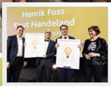
Vangsgutane 2.0 s. 8-10