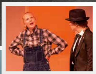
Dramatisering av Tryggheim si historie s. 6