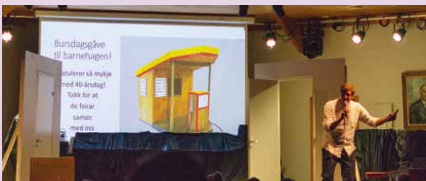
Barnehagen fekk overrekk eit løfte om ein ny bensinstasjon i bursdagsgåve.