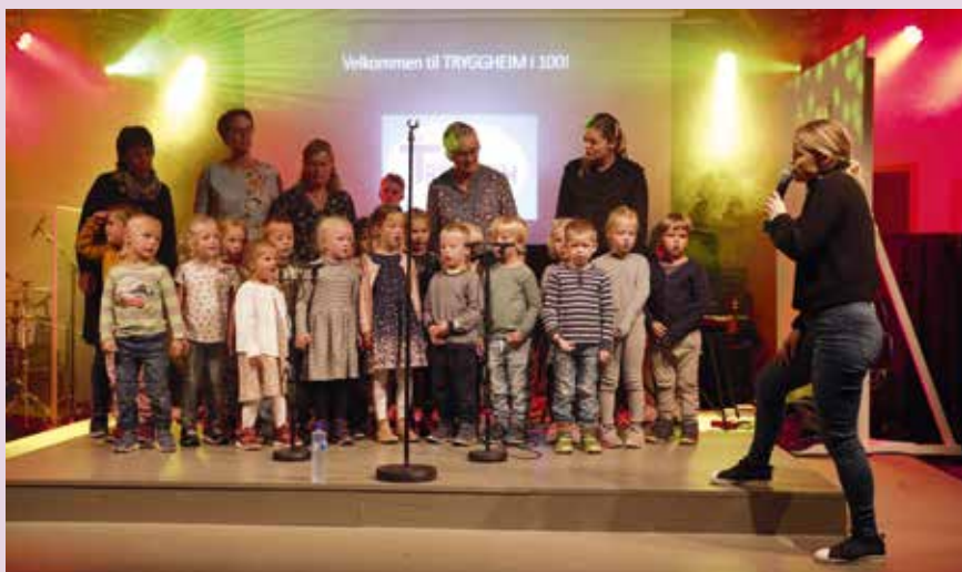
Barnehagebarna fekk synga med Lisa Børud.

Midt i jubileumsåret er det også ein viktig rund dag rett borte i svingen, der feirar nemleg Tryggheim barnehage 40 år dette året. Barnehagen var med på den store bursdagsfesten den 4. september. Dei hadde eigen «VIP-lounge» i nybygget i kantina, dei fekk bursdagsgåve i form av ein bensinstasjon som skal lagast av byggelevane på Tryggheim vgs. I tillegg fekk dei vera med på scenen og synga saman med Lisa Børud framfor eit hav med gira ungdomskule- og vidaregåandeelavar i møtesalen. Barnehagen er nok ein rekrutteringsplass for framtidige elevar på ungdomsskule og vidaregåande skule, og dei gleder mange med sine jamlege utflukter på skuleområdet der dei yngste får kikka litt inn i den moglege skuleframtida rett i nærmiljøet. Og no er også barnehagen snart middelaldrande altså. Og likevel evigung og nysgjerrig som aldri før.