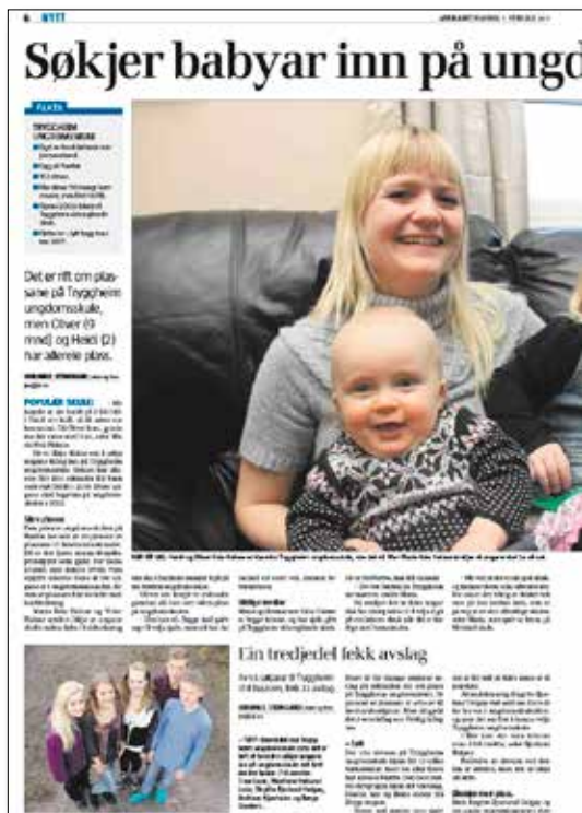
Faksimile frå Jærbladet – Babyar på søknadslista.

Éin ting er Tryggheim sitt gode rykte som ein god skule. I tillegg har me alltid fått tak i gode folk til å fylla dei stillingane me har hatt behov