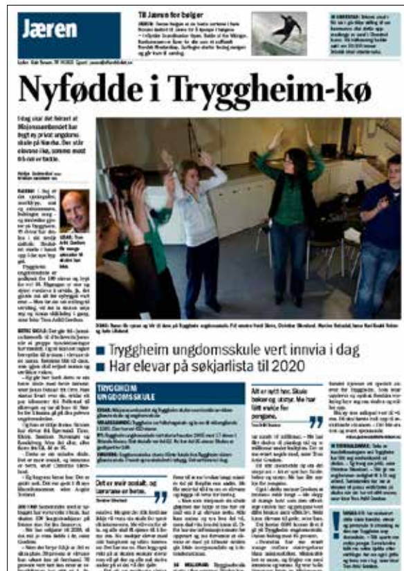
Nyfødde i Tryggheim-kø.