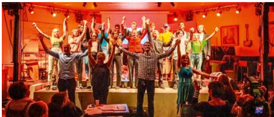
Skodespelarar, scenearbeidarar og kunstnarisk team tok nøgde imot applausen etter framsyninga.

jentebesøk på guteinternatet, samt tyskartida under krigen, stadige namneendringar, byggeprosjekt og morgonandakten. Alt fint fletta saman av gjennomgangsfiguren Tryggheim Askeladd og generasjonane av elevar i kjølvatnet av ein av dei fyrste som gav eit stort pengebeløp til reisinga av skulen.