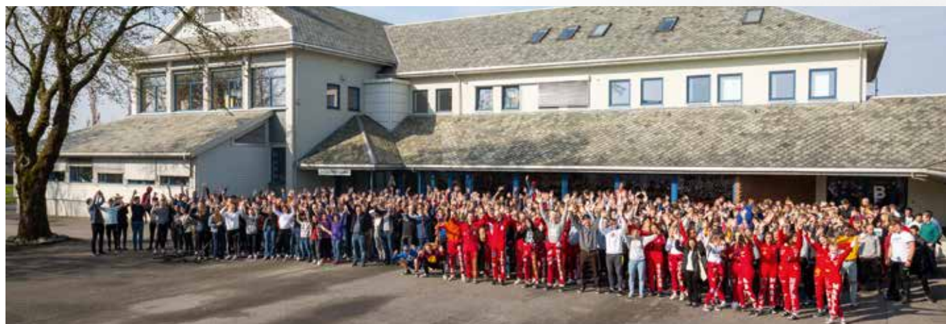
Elevene 2019.