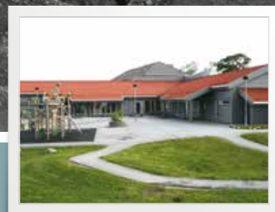
Tryggheim barnehage 40 år s. 11