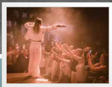
Gamling med "guts" s. 9